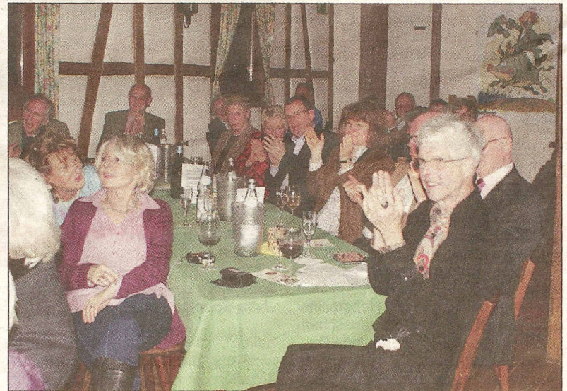
Das Publikum zeigte sich begeistert von Renneisens Darbietungen.